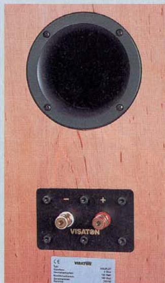
Bei Visaton gibt's keine billigen Plastikterminals, sondern massive Polklemmen auf robuster Metallplatte

recht zur Schallwand in Form einer Keule ab. Dadurch werden nicht nur klangverfärbende Reflexionen von Boden und Decke vermieden. Auch der liegende Betrieb ist nun weitgehend unproblematisch, da die ausgeprägte Richtwirkung in diesem Fall Frühreflexionen von den Seitenwänden verhindert. Abbildung und Räumlichkeit werden so fast nicht beeinträchtigt. Die Bestückung der mit Echtholz-Furnier verkleideten Baßreflexbox ist mit den beiden Aluminium-Membranen der 13er-Tieftöner auf technisch neuestem Stand, was das STEREO-Labor mit guten Meßwerten belegte.